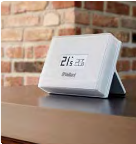
vSMART non installata a parete

vSMART trasforma il tuo smartphone o tablet in un sistema di controllo a distanza per il tuo riscaldamento. Ovunque tu sia e qualsiasi cosa tu stia facendo potrai controllare e regolare il comfort di casa in modo rapido ed estremamente intuitivo sfruttando la tua rete WiFi.