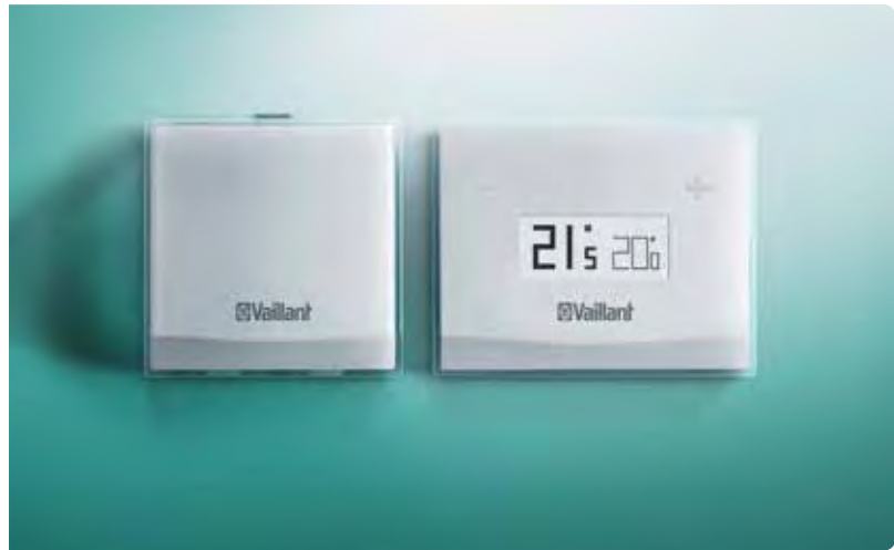
vSMART installata a parete e il suo dispositivo WiFi